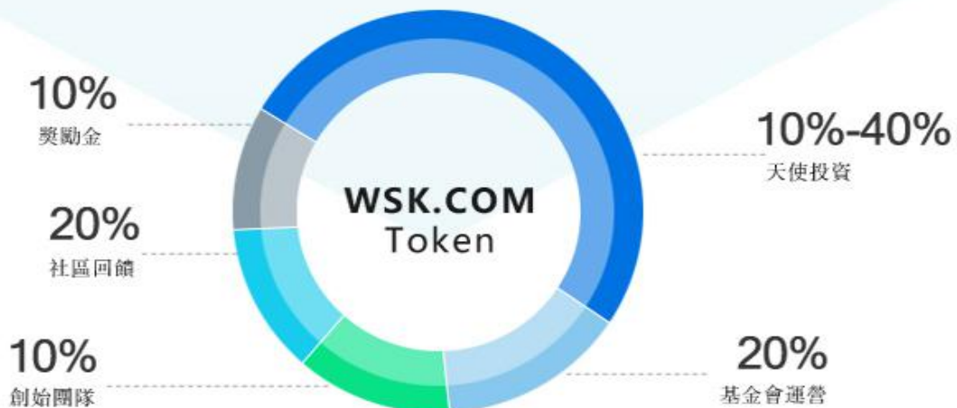
圖 1. WSK 代幣分配